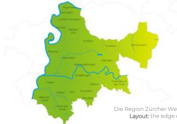
Die Region Zürcher Weinland im Überblick. Layout: the edge creative solutions ag

Der Standortförderverein ProWeinland tritt seit diesem Jahr im Rahmen seiner Tätigkeit für die Umsetzung der Neuen Regionalpolitik als Regionalmanagement Zürcher Weinland auf. Hierfür wurde eine Geschäftsstelle an der Weinlandstrasse 12 in Kleinandelfingen eingerichtet und in Betrieb genommen. Die Geschäftsstelle ist von Montag bis Donnerstag zu festgelegten Zeiten (09.00 – 12.00 Uhr und 14.00 – 17.00 Uhr) besetzt.