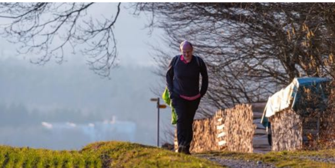
Die Region Zürcher Weinland lädt zum Wandern, Velo fahren und Verweilen ein.

Im Zürcher Weinland gibt es viele schöne Ecken zu erkunden. Um diese Gruppen und Einzelreisenden zum Entdecken anzubieten, organisieren wir Führungen durch die Weinberge sowie Spaziergänge unter kundiger Leitung zu verschiedenen Themen.