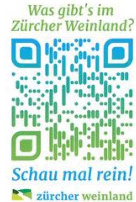
Die Auslage von Informationsmaterial wurde teilweise im Jahr 2020 eingestellt. Ein QR-Code als Kleber konnte da Abhilfe schaffen. Layout: the edge creative solutions ag

Eine Bedürfnisabklärung im Jahr 2021 mit den touristischen Partnern und den Gemeinden der Region soll Aufschluss geben, wie das Ziel einer Tourismusorganisation in der Region umgesetzt werden kann. Denn diese hat mit einem einheitlichen Marktauftritt und zielgerichteter Angebotsgestaltung zum Vorteil, dass die Wertschöpfung in der Region erzielt und gesteigert werden kann.